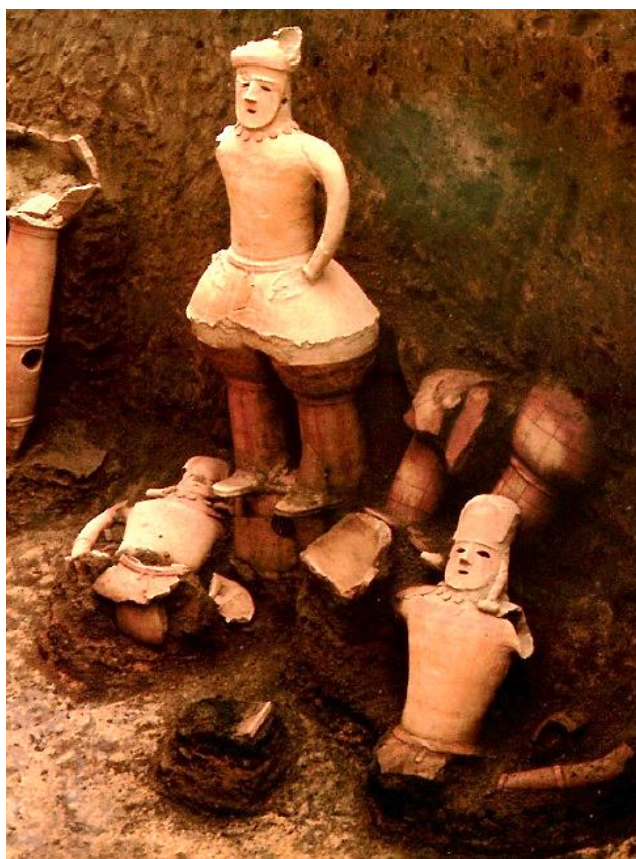
Рис. 3. Ханива в виде человека [6, с. 4]

обычная одежда, по мнению Исино, была элементом не повседневной жизни, а ритуальной [5, с. 9]. Из ряда празднеств и фестивалей, проводимых в древней Японии, Исино отмечает табата-но мацури (праздник Полей), дзимоку-но мацури (праздник Деревьев), праздники гор, рек и моря [5, с. 14]. Как видно, ритуалы и праздники так или иначе связаны с силами природы и с сельским хозяйством.