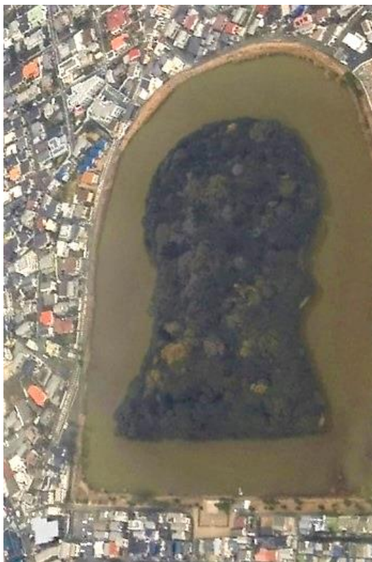
Рис. 1. Квадратно-круглый кофун, префектура Осака.

Исино подвергает критике идею «стандартизации» квадратно-круглых кофун : в III–VII вв. при строительстве курганов очень мало внимания уделялось следованию каким-то стандартам (о существовании которых в древние времена тоже говорить сложно). В расчет брались производственные возможности, особенности местности (которые выгодно использовали при строительстве курганов для уменьшения трудовых и временных затрат), территориальные представления о том, как должно выглядеть захоронение правителя [1, с. 4]. Кроме того, значительное изменение формы кургана могло произойти из-за трансформации ландшафта по естественным причинам, произрастания деревьев и хозяйственной деятельности человека, что усложняет идентификацию формы кофун и правильность ее определения [Там же, с. 8].