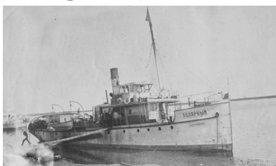
Рис. 1. Пароход «Полярный» Торгового дома «Наследники А. М. Кушнарева» [3]

Северо-восточная Сибирь снабжалась товарами потребления только благодаря открытию пароходства крупными фирмами [9, л. 147]. В 1916 г. у фирмы «Наследники А. М. Кушнарева» числилось два парохода, четыре баржи [10, л. 93] (рис. 1, 2).