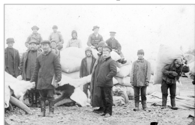
Рис. 4. Сбор пушнины и мамонтового бивня приказчиками Торгового дома «Наследники А. М. Кушнарера» [3]

Данная торговая организация в исследуемый период на территории Северо-Восточной Сибири сформировала определенные обычаи делового оборота, свершение большинства сделок «на доверии» и вовлечение практически всего населения края в систему меновой торговли пушниной на товары широкого потребления. Именно из состава «булунского купечества» выросли крупные торговые дома, поскольку западная тундра была наиболее богата пушными зверями. Также следует отметить, что завоз товаров именно в эту часть северного края был более удобен и доступен, чем гористая и сложно проходимая восточная тундра, где к тому же было сильно влияние американских торговцев.